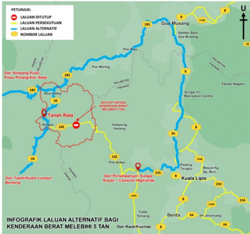
INFOGRAFIK LALUAN ALTERNATIF BAGI KENDERAAN BERAT MELEBIHI 5 TAN